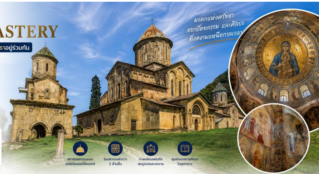
มรดกแห่งศรัทธา สถาปัตยกรรม และศิลปะ ที่งดงามเหนือกาลเวลา