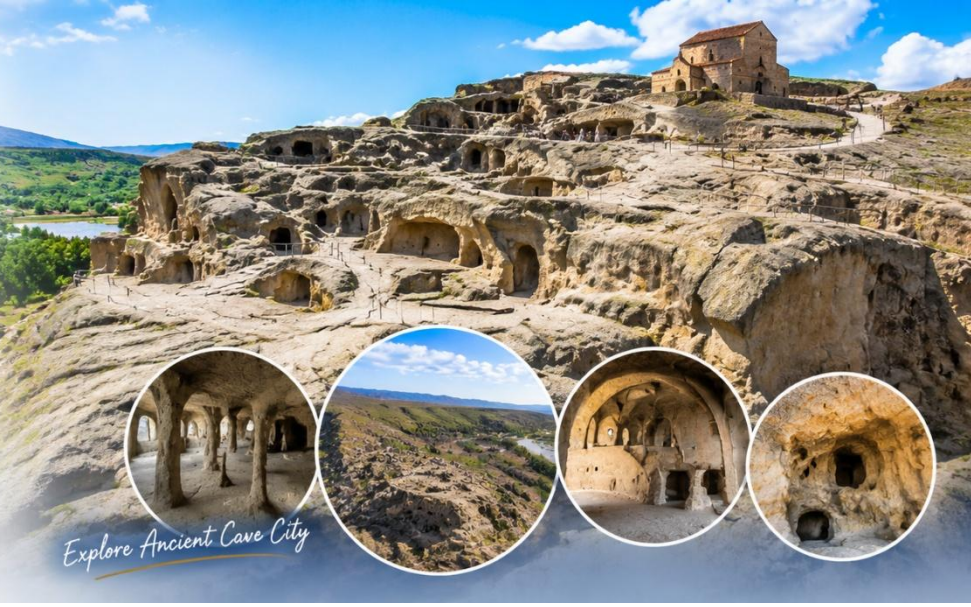
Explore Ancient Cave City

นำท่านเดินทางสู่เมืองคูไตซี (Kutaisi) (ประมาณ 145 กม./1.50ชม.) เมืองนี้มีความเจริญเป็นอันดับสองรองจากทบิลีซี ชมความสวยงามของเมืองคูไตซี ซึ่งมีชื่อเสียงทางด้านวัฒนธรรมและได้รับการขึ้นทะเบียนให้เป็นมรดกโลก ซึ่งถ้าย้อนกลับไปเมื่อสมัยศตวรรษที่ 12-13 ได้เคยเป็นเมืองหลวงเก่าแก่ของอาณาจักรโคลคลิส (Empire of Colchis) และอาณาจักรอิมเรทียา (Kingdom of Emetia) ที่อยู่ทางด้านของตะวันตกของประเทศ